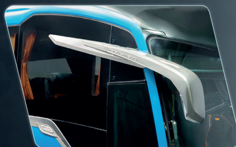
Visibilidad del espejo retrovisor ampliada.