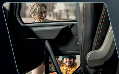
El área translúcida en la puerta permite la visualización de obstáculos en el costado del vehículo.