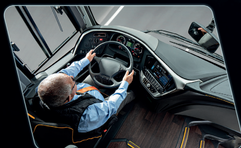
Remodelación del puesto del conductor, proporcionando mayor visibilidad al conductor.