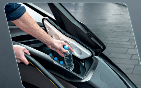
Posibilidad de añadir un refrigerador al lado del conductor, lo que lo hace práctico para el conductor.