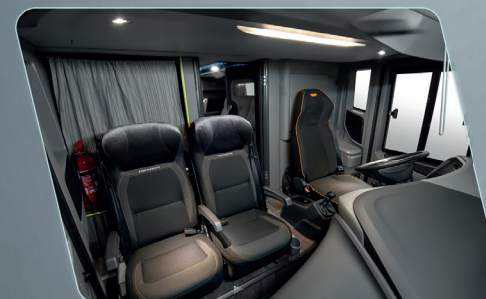
Más espacio en la cabina.