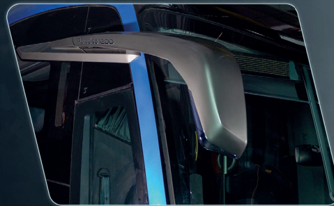
Visibilidad del espejo retrovisor ampliada.