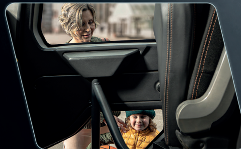
El área translúcida en la puerta permite la visualización de obstáculos en el costado del vehículo.