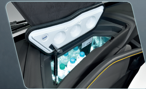
Refrigerador integrado en el panel, que brinda practicidad al conductor (opcional).