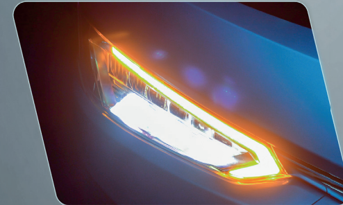
Conjunto óptico mejorado con faros de largo alcance y luz de maniobra.