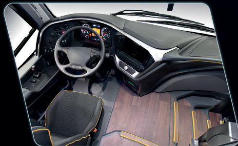
Remodelación del puesto del conductor, proporcionando mayor visibilidad al conductor.