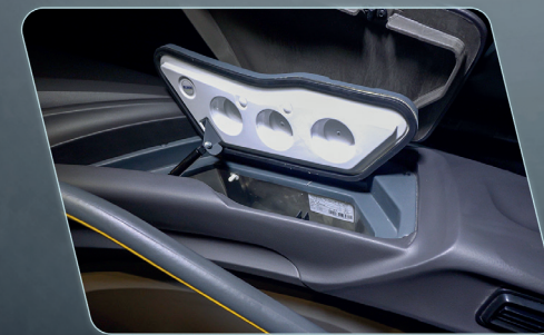
Refrigerador integrado en el panel, que brinda practicidad al conductor (opcional).