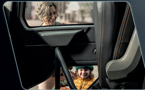
El área translúcida en la puerta permite la visualización de obstáculos en el costado del vehículo.