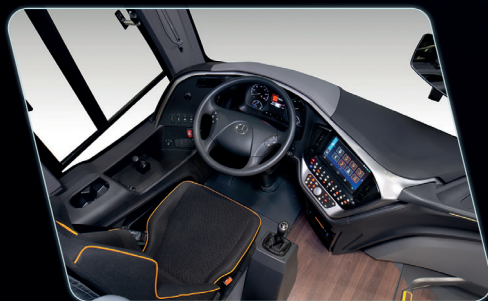
Remodelación del puesto del conductor, proporcionando mayor visibilidad al conductor.