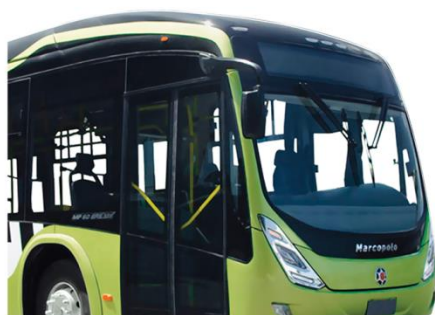
Parabrisas de una sola pieza

Desarrollados con enfoque en la ergonomía