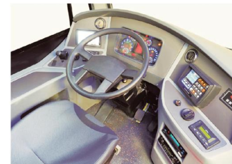
Puesto del conductor con un panel completo de comando

Autobuses ensamblados por Polomex S.A. de C.V. y Marcopolo S.A.