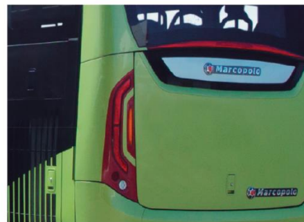
Señalización externa con LED en las luces de posición, dirección y frenado